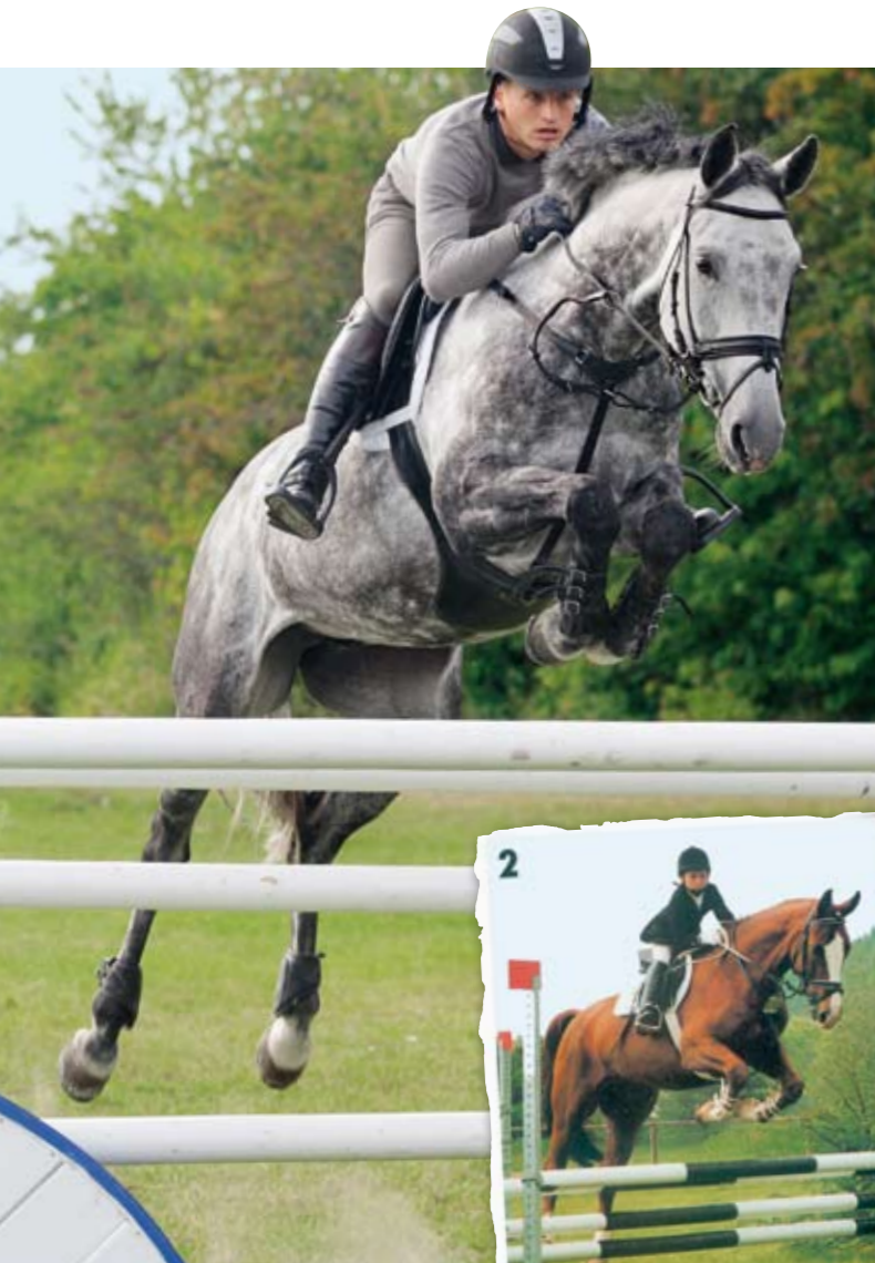
2 Der Reiter zeigt eine sehr gute Beinhaltung, das Gesäß kommt korrekt aus dem Sattel.

Der Himmel weiß es bereits. Aber er sagt nichts. Er allein weiß, dass in zwei Wochen dem Erfolgsbuch mit der Überschrift „Buschreiter Michael Jung“ ein weiteres Kapitel hinzugefügt werden soll. Ein zentrales Kapitel, das den Überraschungsweltcup Sieger 2009 zum WM-Anwärter 2010 werden lässt. Der Weg nach Kentucky führt über Fontainebleau. Offiziell geschrieben steht das nirgends. Aber alle wissen das. Offizielle wohl genauso wie das Bundestrainer-Duo. Und auch die deutsche Kernmannschaft, die Olympiasieger und Weltmeister. Jene Sechserbande, die in abwechselnder Teambesetzung für das „Unternehmen Edelmetall“ der Buschequipes verantwortlich zeichnet. Ein Inner Circle, in den hineinzukommen nicht einfach ist. Zumal im kommenden Jahr ein hoffentlich wieder voll gesunder Marius mit Hinrich Romeike einen Teamplatz sicher haben dürfte.