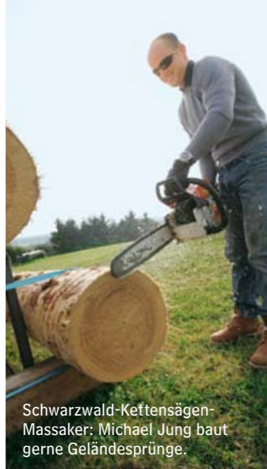
Schwarzwald-Kettensägen- Massaker: Michael Jung baut gerne Geländesprünge.