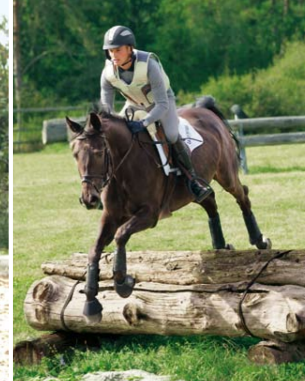
Los geht's! Mehr als 50 selbstgebaute Buschhindernisse von Coffin bis Sunken Road warten auf der Wiese am Hang.