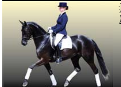
St.Pr.A. Dark Magic v. Danone - Wolkenstein